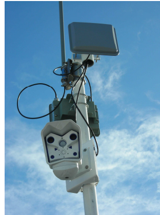
Pylône NetABord équipé d'une caméra interactive

Audit et expertise des réseaux Réseaux hyperlan Réseaux sans fil temporaires Solutions individualisées PME